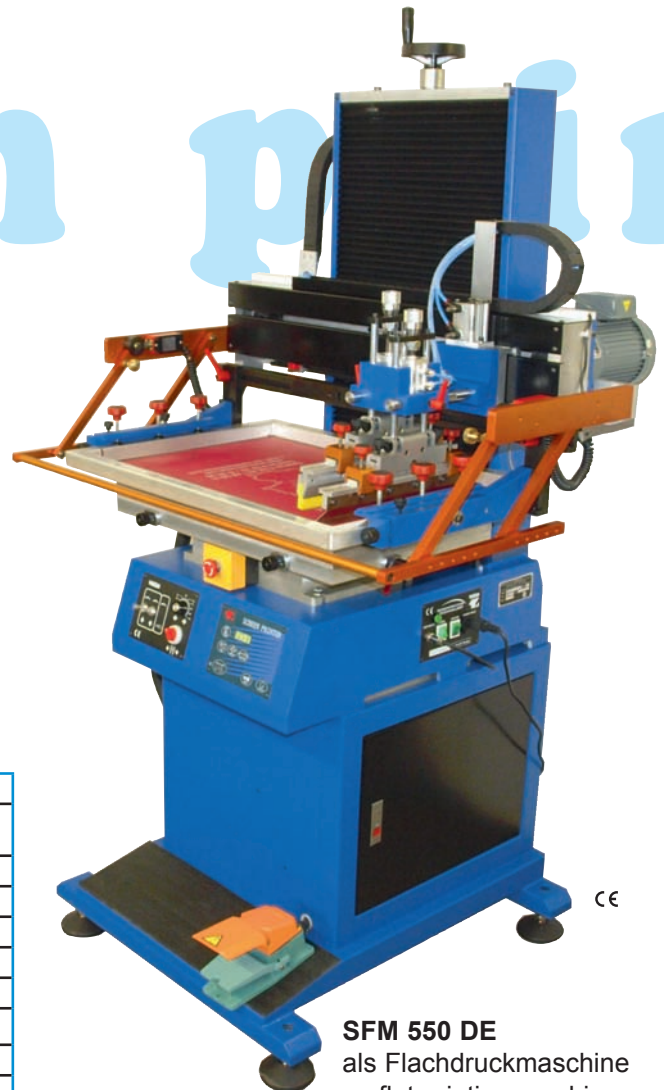
SFM 550 DE als Flachdruckmaschine as flat printing machine